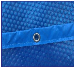
Isothermabdeckplane Isothermic cover CV7900892