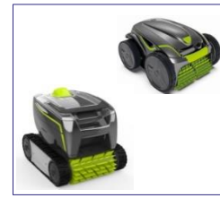
Roboter Robot GT3220/GV3420